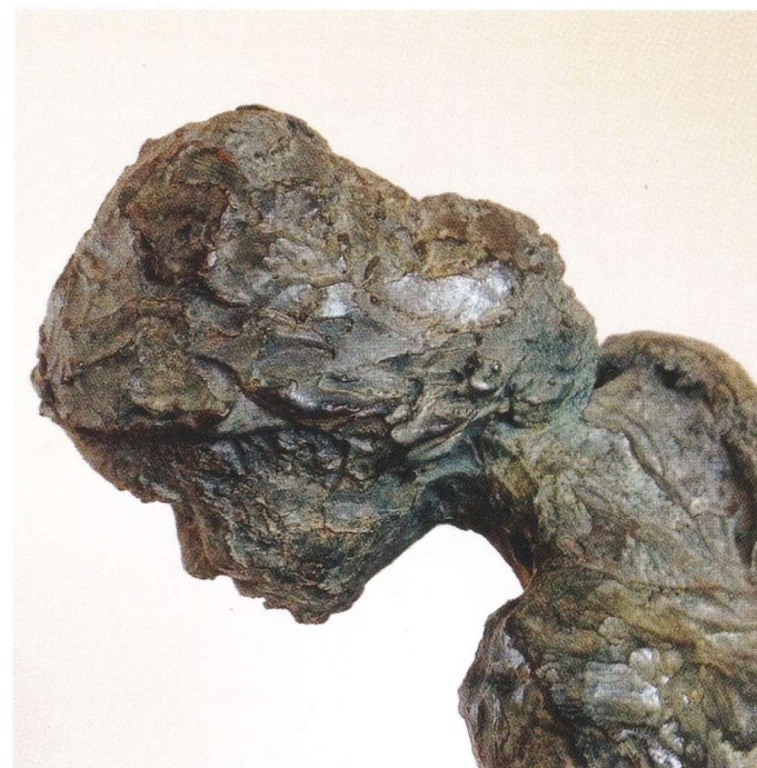
Brigitte BIZORD Sculpteur